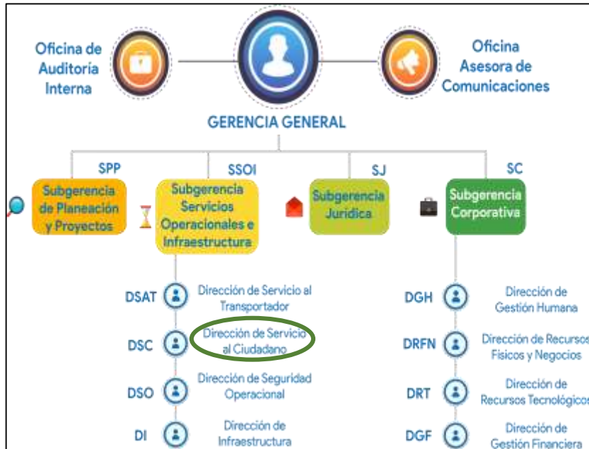
Ilustración 3. Organigrama Terminal de Transporte S.A.

servicios administrados por la Terminal de Transporte S.A. en condiciones de equidad e inclusión, contribuyendo de esta manera a mejorar su movilidad y calidad de vida. Esta Dirección hace parte de la Subgerencia de Servicios Operacionales e Infraestructura. A continuación, el organigrama de la empresa: