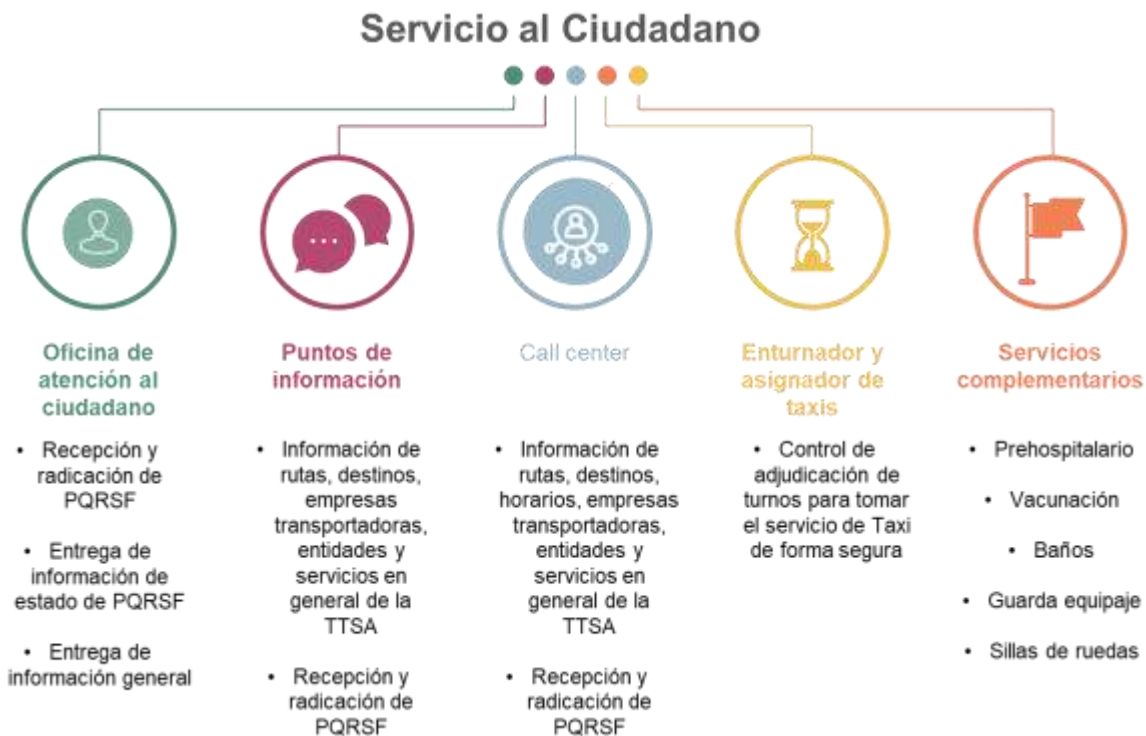
Ilustración 4. Relación de Servicios.