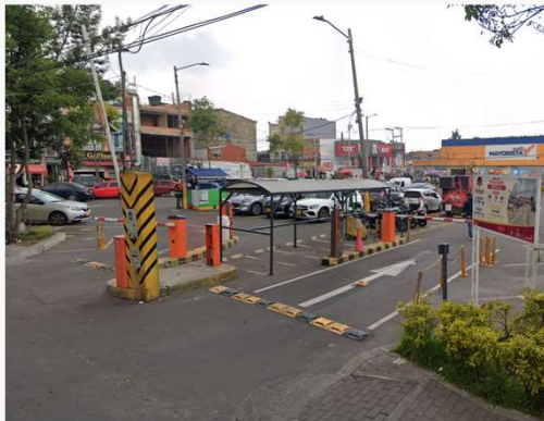
Parqueadero Terminal Castilla

Contamos con 1 estacionamiento en la localidad de Kennedy