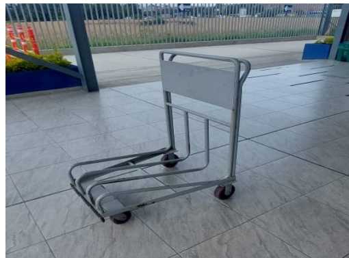
Imagen real segundo modelo carros maleteros norte (25)

I.MANTENIMIENTO PREVENTIVO: El contratista deberá planificar y concertar con la Terminal de Transporte S.A., el cronograma de los cuatro (4) mantenimientos preventivos. Se debe gestionar el tiempo de inactividad para que no afecte la operación. Se deberá prestar el servicio de mantenimiento preventivo, según sea el caso para los cuarenta y siete (47) carros maleteros al servicio de la Terminal Satélite del Norte (grupo 2).