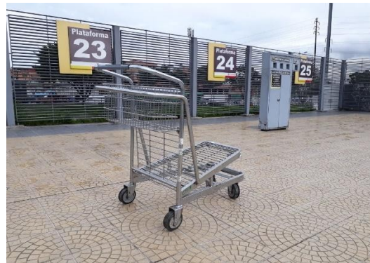
Imagen real del diseño actual carros maleteros sur (76)

Documento firmado electrónicamente - 2024-07-03 17:29:37