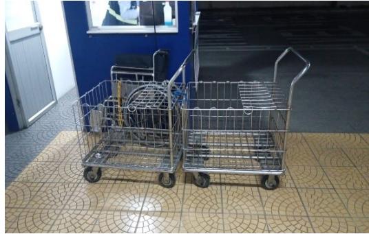
Imagen real carros de proveedores sur (2)

I.MANTENIMIENTO PREVENTIVO: El contratista deberá planificar y concertar con la Terminal de Transporte S.A., el cronograma de los cuatro (4) mantenimientos preventivos. Se debe gestionar el tiempo de inactividad para que no afecte la operación. Se deberá prestar el servicio de mantenimiento preventivo, según sea el caso para los setenta y ocho (78) carros maleteros al servicio de la Terminal Satélite del Sur (grupo 1).