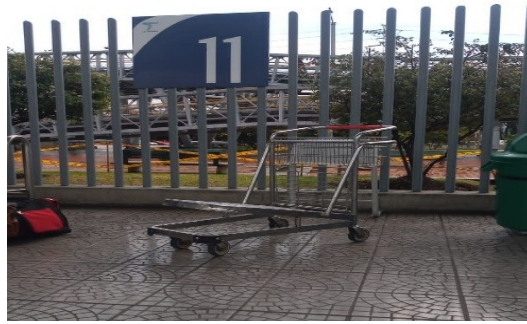
Imagen real primer modelo carros maleteros norte (20)

Documento firmado electrónicamente - 2024-07-03 17:29:37