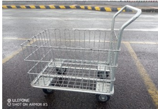
Imagen real carros de proveedores norte (2)